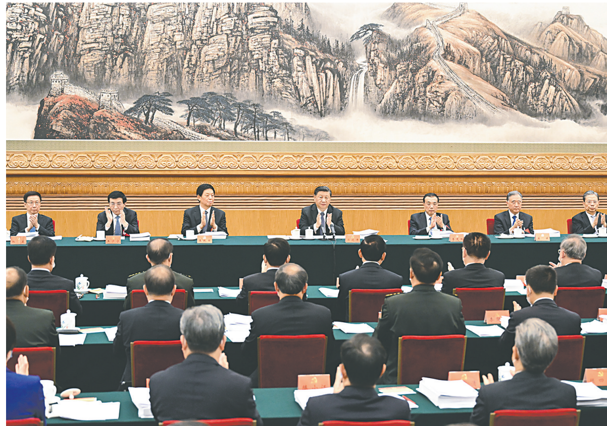
10月18日,中国共产党第二十次全国代表大会主席团在北京人民大会堂举行第二次会议。习近平同志主持会议。