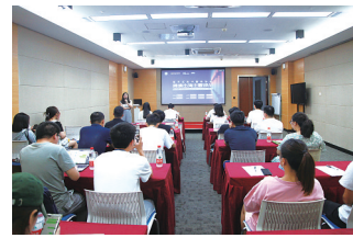
跨境电商主题沙龙