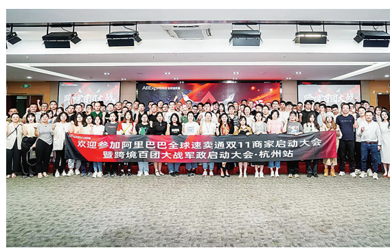
速卖通“双11”启动大会