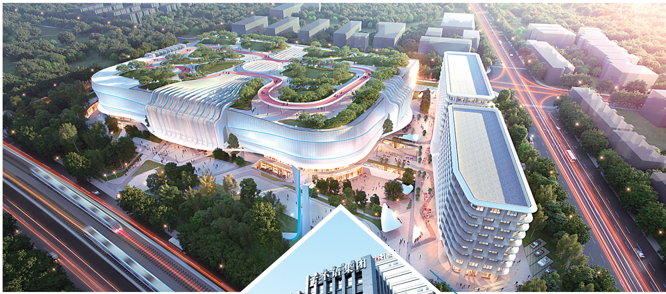
遥望数字化服装采销产业基地效果图

培育出上市跨境电商企业，拥有多家头部直播机构，众多电商成绩傲视群雄，这些累累硕果的背后，反映出临平区委区政府坚持把发展电商产业作为加快产业转型升级重要抓手，使其更好更快拉动经济高质量发展。作为电商产业主管部门，区商务局一直在政策扶持、氛围营造、人才招引、数字化改革、合作对接等方面，为企业提供全方位的周到服务。如今，临平正在向新电商标杆区加速迈进——