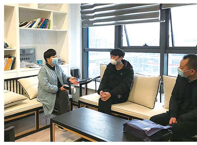
疫情期间，商务局走访服务子不语集团

结合杭州市跨境电商新政出台契机，围绕人才、商家关切，接下来，区商务局将深化党建联建载体，优化电商产业营商环境，谋划完善区级产业和人才政策，增强双招双引力度，进一步激发临平电商发展的澎湃活力。