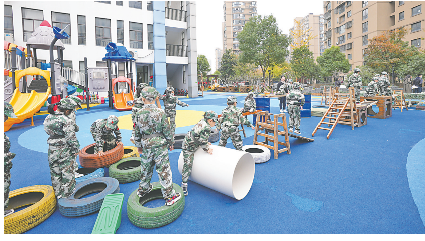
世纪园区的孩子们在体能训练中感受红军长征路上的艰险

育学校都会安排“红色主题”教育，让孩子们能够亲身去体验，在有趣且富有挑战的游戏情节中真切感受伟大的民族精神，从而培养孩子们的民族自