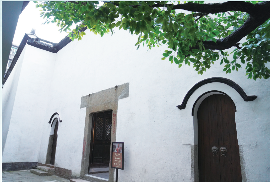
位于临平街道缸髯弄的俞樾纪念馆,于2023年8月开馆,全面展示了朴学大师俞樾的风采以及他与临平的深厚渊源。

俞樾堪称读书的好苗子,在母亲的悉心教导下,短短三年便学完了“四书”。为了让俞樾学习更高深的知识,母亲决定为他觅一位塾师。多年以后,俞樾写诗回忆这段时光:“儿时钝笔真惭愧,九岁才能毕四书。”此乃俞樾的自谦之辞,三年学完《论语》《孟子》《大学》《中庸》,实乃学霸之