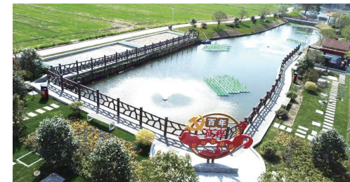
李家桥村生态主题公园