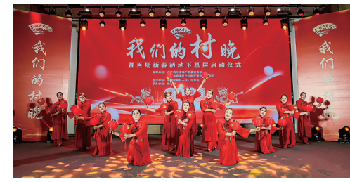
东湖大舞台“我们的村晚”

2024年是中华人民共和国成立75周年，是实现“十四五”规划目标任务的关键一年。东湖街道将全面落实省市全会精神，锚定“融杭接沪梦想地、智能制造创新地、产城融合示范区”的总目标，始终保持“一张蓝图绘到底”的战略定力，为推动临平在全省“勇当先行者、谱写新篇章”、全市“勇攀高峰、勇立潮头”新征程中当好桥头堡、建设示范区展现东湖担当。