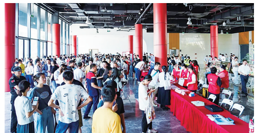
“临聚人才·相约东湖”百企千岗招聘会现场

民之所盼，必有回响。东湖人，以一项项饱含温度的举措，回应着民众的热切期盼，用一件件民生实事的落地，绘就生活的幸福图景，持续提升人民群众的获得感、幸福感、安全感。