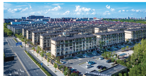
胡桥家园南区临聚人才公寓