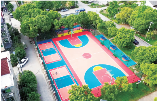
街道2023年度完成嵌入式体育场地建设5100余平方米