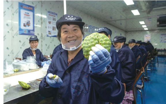
运河北部四村成功入选省级共同富裕实践观察点名单

走进“临里印巷”，鼎沸的人声伴着食物的香气，一派人间烟火的热闹景象。1月下旬，浙江省文化和旅游厅评选出全省第二批重点培育文旅市集，临里印巷共富文旅市集榜上有名。