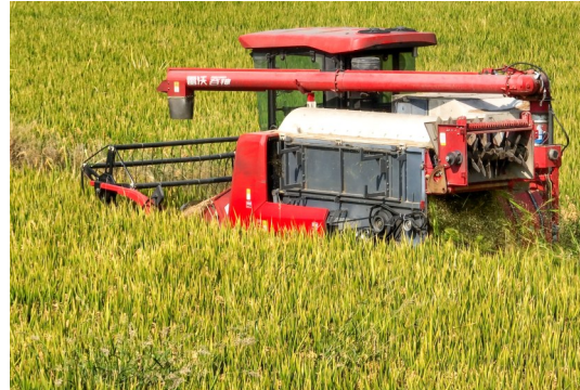
运河水稻亩产创造临平区单季晚稻亩产新纪录