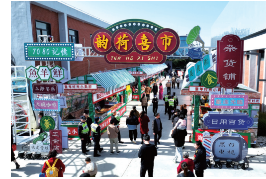
第十四届大运河鱼羊美食节“飘香满堂”