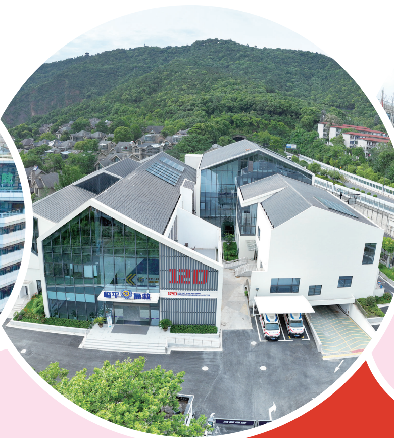
区急救中心新址全面投用