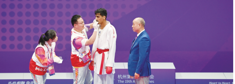
亚（残）运会期间医务人员为运动员进行伤口处理