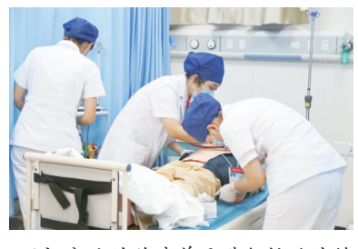
运河分院的胸痛单元进行救治演练