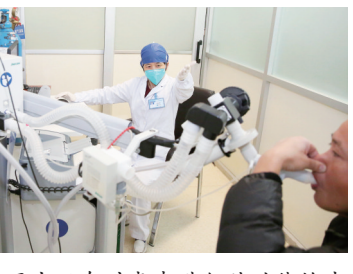
医生正在对患者进行肺功能检查

再发力，再突破，再提升。2024年，临平卫健将锚定推进高水平“数智临平·品质城区”建设的定位目标，紧抓卫生健康发展新机遇，充分发挥基层动能，全面构建“大健康”格局，着力塑造“健康+医疗能力”“健康+基层卫生”“健康+公共卫生”“健康+遇健临平”“健康+卫健铁军”五方面新优势，为推进共同富裕和卫生健康现代化贡献更大的临平力量。