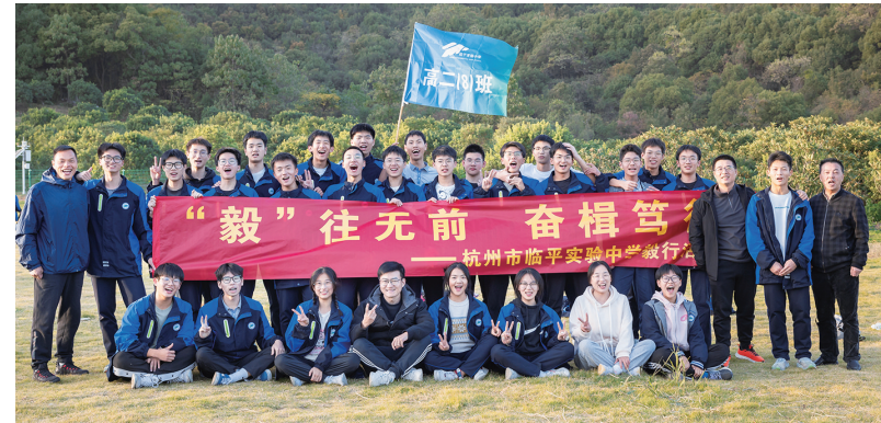
“毅”往无前 奋楫笃行——起山励志行