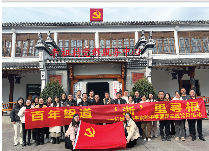
重温真理的味道——党员考察学习

领；突出目标引领，推进“四引四联、三精三全”党建特色项目实施和党建“四融工程”，打造学校“求实”党建品牌，获评教育系统“2023年党建示范点评估优秀党组织”；突出方法引领，坚持“支部建在连上”，优化二级支部工作机制，增强党建工作活力；突出典型引领，开展“身边的那道光”优秀党员先进事迹报道活动，激励党员立足三尺讲台，创先争优，培育人才。