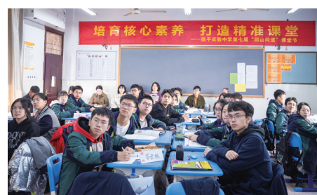
“做学教一体化”课堂