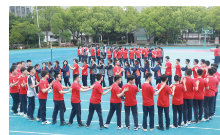
高考冲刺励志活动