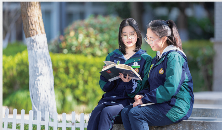
阳光自信、励志进取的实中学子