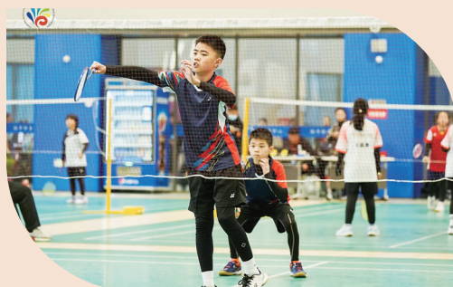
2023年临平区第二届小学羽毛球比赛