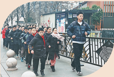
六年级校外绿道晨跑