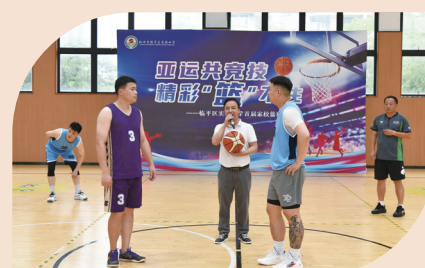
区实验小学首届家校篮球赛

此外，学校积极建设教工社团，飞盘、瑜伽、健身舞蹈、健走、乒乓球、羽毛球、气排球、篮球、游泳等广受好评。社团的建设，促进了教师自我的身心健康发展，点燃了教师团队的活力，也营造了学校教师健康向上的氛围，为打造一支战斗力