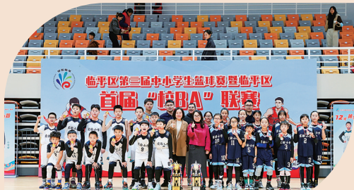
临平区首届“校BA”联赛冠军合影

2023年度，学校在临平区第三届中小小学生篮球赛暨临平区首届“校BA”中取得男篮冠军、女篮亚军的优异成绩；在2023年临平区第二届小学生羽毛球比赛中荣获团体第二名；在2023年临平区第二届游泳比赛中荣获团体第三名；校田径队获得区田径运动会团体第五名；在2023年临平区第三届中小小学生健美操、啦啦操比赛中获得团体总分第七名；在2023年杭州市第四十六届少儿阳光体育小学生“三跳”比赛中获得“3分钟集体8字跳”“2×60秒交互绳接力”三等奖。