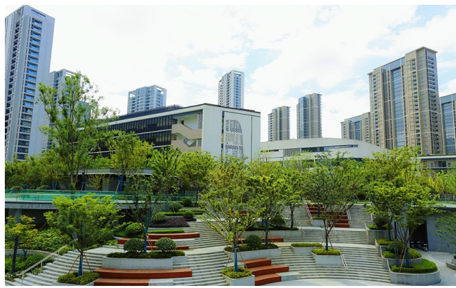
亚运会媒体村地块配套景观项目

杭州金锄市政园林工程有限公司成立于2002年9月,主营范围涵盖市政公用工程、园林绿化工程、电子与智能化工程、建筑装修装饰、建筑工程施工、古建筑工程、城市及道路照明、地质灾害治理等不同领域。公司连续多年获得“浙江省工商企业信用AAA级‘守合同重信用’单位”“优秀园林绿化企业”“纳税先进单位”等荣誉称号。