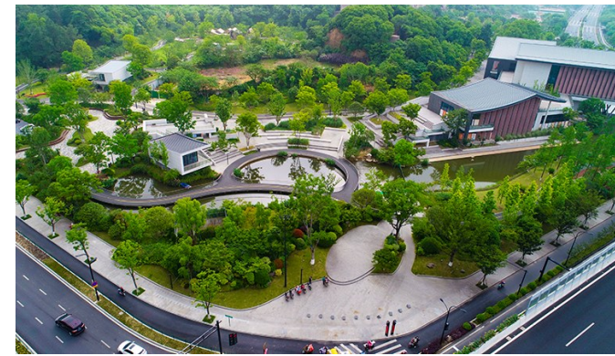
临平山运动休闲公园(项目获浙江省建设工程“钱江杯”优质工程奖)

杭州天顺市政环境建设有限公司成立于2003年8月,是一家集城市园林绿化、市政公用工程、建筑工程、建筑装修装饰、古建筑工程、城市及道路照明、环保工程、物业服务等多专业化的综合型企业。是国家高新技术企业,也是国家、省、市各行业学会、协会的会员和理事单位。公司连续多年获评省AAA级“守合同重信用”单位、“优秀建筑业企业”和“纳税先进单位”。