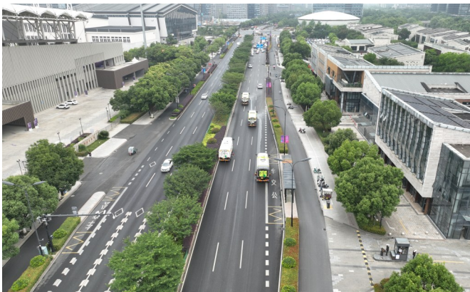
良睦路道路保洁项目

杭州宏运绿化工程有限公司施工范围涵盖城市园林绿化、市政公用工程、建筑工程总承包、物业管理、水利水电工程、幕墙专业、建筑装修装饰工程、城市及道路照明、环保工程等诸多领域,集环卫保洁、绿化养护于一体多元化发展。