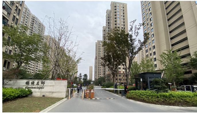
锦绣名邸物业管理项目

杭州广延建设有限公司成立于2010年,经营项目为物业管理、道路养护、保洁、建筑施工等多项服务。公司具有建筑工程、消防、建筑装修装饰等二级资质、建筑机电安装、水利水电、市政公用等三级资质。公司自有新能源环保三位一体清扫车、扫地车、高炮洒水车、喷雾车、路灯登高车、音乐垃圾车等众多设施设备。现有50多名综合型管理人员,另有400多名保洁及绿化养护人员。2016年-2023年连续7年被区城管局评为市容环卫先进集体,并于2022年被临平区建设局评为四星级物业服务企业。公司本着“以一流的服务创造广阔的市场”为发展理念,始终致力于城市经济建设和塑造居民的美好生活。