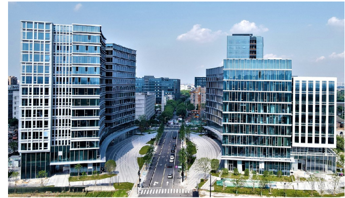
余政工出[2020]15号纺织服装、服饰业项目

杭州巨龙建筑工程有限公司成立于1998年,目前为塘栖镇重点企业、2020年是临平区建筑业十强企业之一。公司具备国家房屋建筑工程施工总承包贰级、建筑装修装饰工程专业承包贰级、消防设施工程专业承包贰级、市政公用工程施工总承包叁级、城市园林绿化等诸多专业资质。