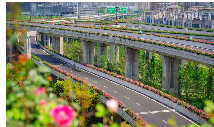
临平东湖高架快速路项目

杭州超美园林绿化有限公司成立于2001年,是一家集城市园林绿化、市政、房建施工总承包、建筑装饰装修工程和绿化养护、市容环卫等多项资质于一体的综合性实力企业。