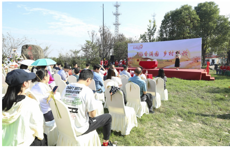
社区举办的第五届丰收节现场

在南苑街道的长树社区，丰收的喜悦与田园文化的和谐共鸣交织成一幅生动的画卷。今年的第五届丰收节不仅是稻谷泛黄的标志，更是社区共同富裕和文化振兴的象征。在这里，每个角落都散发着节日的欢愉，每个笑容都映照着丰硕的成果。