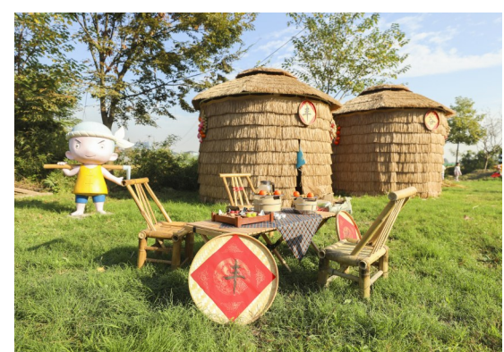
城市社区中独特的田园风光

在未来的发展道路上，南苑街道长树社区将继续以丰收节为契机，深化乡村振兴和文化遗产的实践。社区还计划开展更多文化和艺术活动，如书画展览、传统手工艺教学等，进一步提升居民的文化素养和生活品质。同时，社区也将继续努力，为居民提供更多优质的居住环境，共同绘制出一幅和谐美丽的乡村新景象。