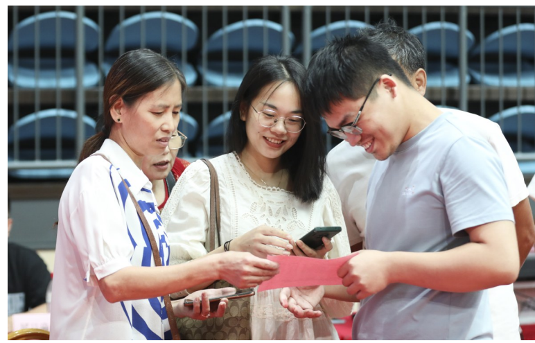
拿到了心仪的新房，掩饰不住内心的喜悦

2023年8月31日是南苑街道天万社区一个值得纪念的日子。这一天，在临平区理想体育中心，432户安置户在万合君汇嘉苑的分房摇号活动中喜提新居，迎来了新的生活篇章。