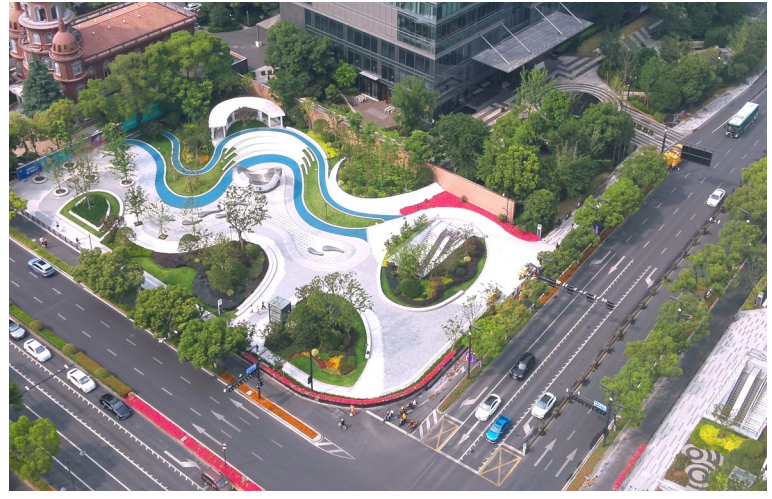
亚运场馆周边环境提升代表性项目（雅韵公园）

近年来，南苑街道东安社区在城市治理、品质提升和文明创建等方面取得了显著成果，活力与动能得以明显释放。东安社区以杭州亚运为契机，工作重心稳步下移，落地落实了一大批民生实事项目。完成老旧小区改造后，我们看到了一张张灿烂的笑脸；在南兴里，我们看到了一个个未来生活的画面；霓虹闪烁，我们看到了百人共舞健身的场景……这一切，就是东安人民幸福的样子。