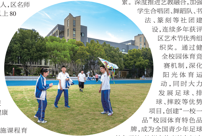
学校还积极实施课程育人工程，创建“运栖智慧”班主任工作坊，进一步完善班主任培训体系。