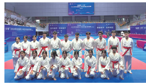
学校在2024年全国青少年空手道U系列赛(浙江站)斩获体育道德风尚奖等多个奖项。

值得一提的是，学校推出的区精品课程《“衍”生乡情》，在纸艺作品内渗透家乡人文风景，体现了独一无二的地方特色，为学生打下热爱家园的情感基础。在塘栖二中，劳动形式不局限于课内，还有校外与社会。学校积极带领学生参与“彩虹计划”和“四季彩虹”公益活动，一次次的爱心帮扶让学生们体会到了劳动的价值，劳动热情不断高涨。