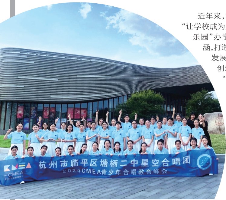
学校星空合唱团以示范团身份，赴约2024CMEA全球青少年合唱教育峰会。

近年来，塘栖二中先后为各级各类学校输送了大量品德好、学习优、个性鲜明的毕业生，培养了一批师德高尚、业务能力强、有创造力的优秀教师，为当地教育界培养了许多中小学教育专家，学校自身也营造了特色鲜明的文化氛围。新校区，新起点，学校将矢志不渝坚守教学初心，奋发有为履行育人使命，以党建为基石、以德育为旗帜、以质量为桨舵、以社团为舞台，致力打造适合现代教育的精品学校，书写育人新篇章。